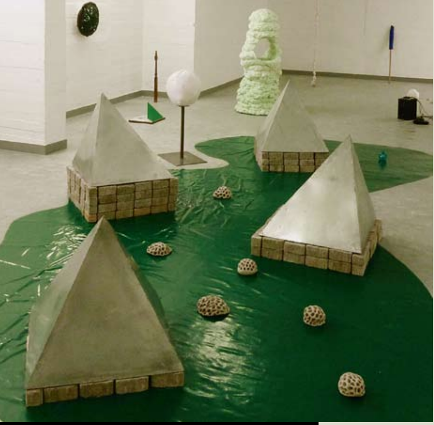
(7) Amédée Loumrière, *1985, Nizza